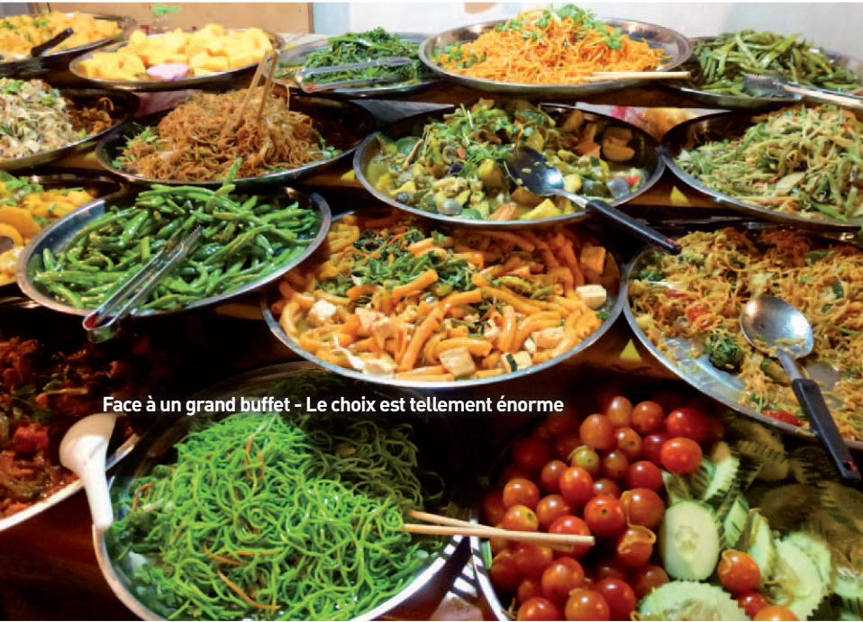
Face à un grand buffet - Le choix est tellement énorme